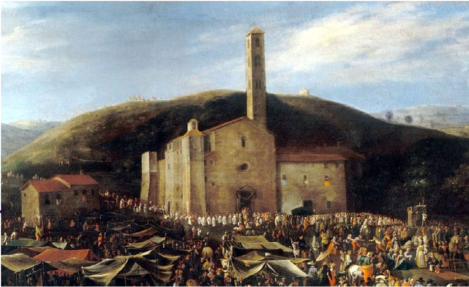
Part. della chiesa dell'Impruneta, di F. Napoletano, sec. XVII, foto tratta da MeisterDrucke.

popolo infinito, estendendosi gl'indulgenza pontificia ancora a tutti quei fedeli, che nel tempo che si dava la detta benedizione, si fossero inginocchiati a pregare Maria Santissima ed acciò tutto il popolo fiorentino godesse di questa indulgenza, nel tempo che si dava all'Improneta la benedizione; qui sparono ambe due | le fortezze, mediante alcuni segni dati con i mortaletti dai cannonieri, che erano sparsi in molti posti per la strada che conduce all'Improneta; dopo dunque di tante devozioni, in breve tempo il male epidemico cessò, e ritornorno le cose nello stato suo primiero”.