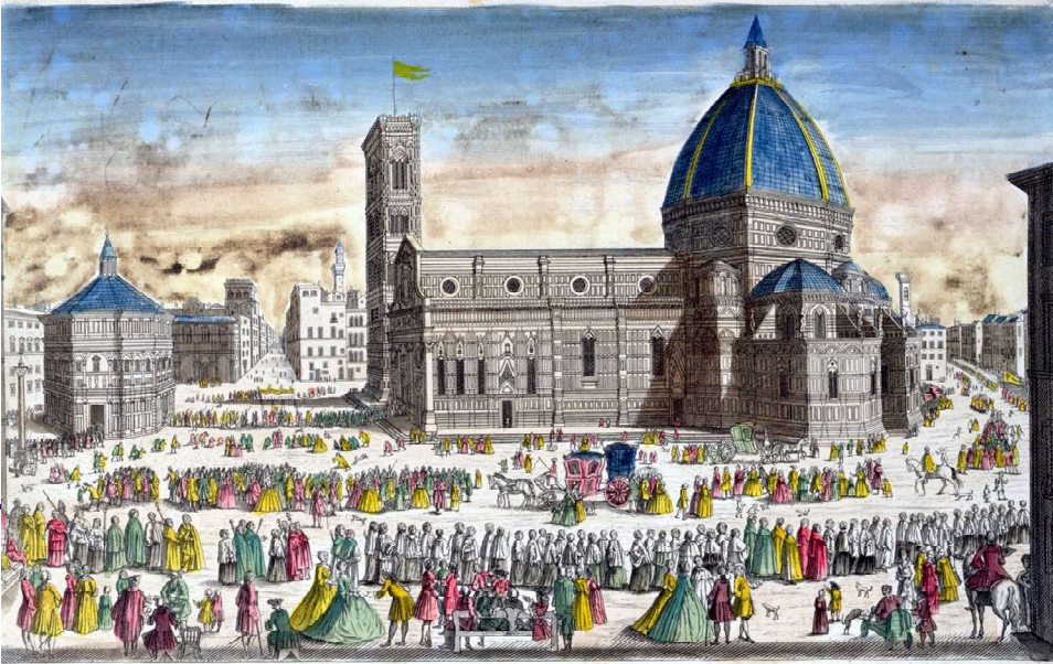
Processione del SS. Sacramento intorno al duomo di Firenze, Scuola francese del XVIII secolo, da Meisterdrucke.

Seguiva per anco nello Stato della Chiesa la mortalità delli animali bovini, perciò si mosse il sommo pontefice Clemente XI, felicemente sedente, mandare un'ampia indulgenza plenaria in forma di giubileo con obbligo di visitare le chiese, da cui fosse partita la processione e quella a cui fosse terminata, con dare qualche limosina, digiunare un giorno della successiva settimana, e confessarsi e comunicarsi; tutto a fine di impetrare perdono alle nostre colpe e cessassero così i divini flagelli.