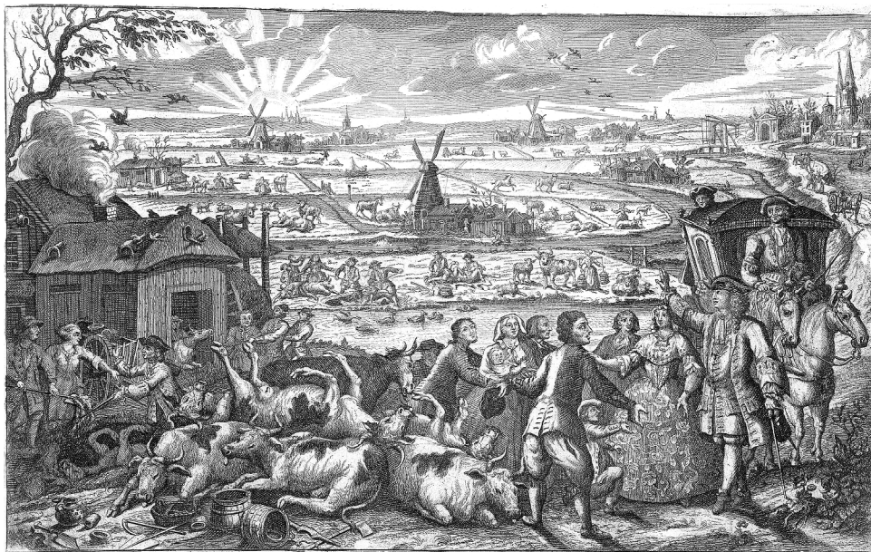
La peste bovina nei Paesi Bassi nel 1745, Jan Smit, foto tratta da https://www.rijksmuseum.nl/ e da Wikimedia Commons.

ma mattina poi, dopo una breve esortazione al popolo nel riportarsi alla chiesa, e nel partirsi il sacro tabernacolo, risuonavano le valli e monti e, nella bocca di ognuno ad alta voce, si sentivano queste parole: «E viva Maria, e viva Maria».