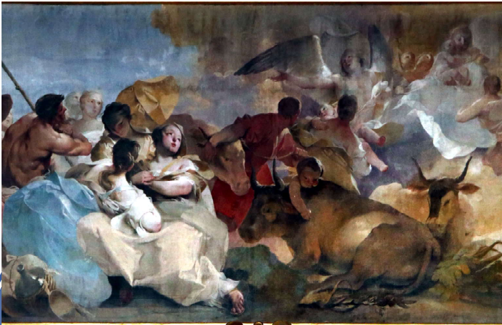
Fine della peste bovina, di G. D. Ferretti, 1721-23, S. Maria, Impruneta.

Nel passato la peste bovina, una malattia infettiva causata dal virus morbillivirus – detto così perché correlato a quello del morbillo – causò in Europa una forte mortalità del bestiame e degli ungulati in generale. Pur non essendo trasmissibile all'uomo, decimò gli allevamenti, provocando una crisi nell'alimentazione e nella forza lavoro.